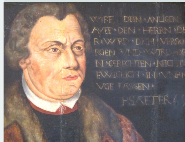
Luthergemälde aus dem 17. Jahrhundert Schenkung der Grafen vom Hagen

Der Förderkreis begleitet die Sanierung und wirbt Spenden für den Kirchbau ein. Mitglied im Förderkreis kann jeder werden, der das Projekt unterstützen möchte und einen jährlichen Beitrag von 30 Euro leistet. Dabei kommt es nicht auf den Wohnort oder die Kirchenzugehörigkeit an.