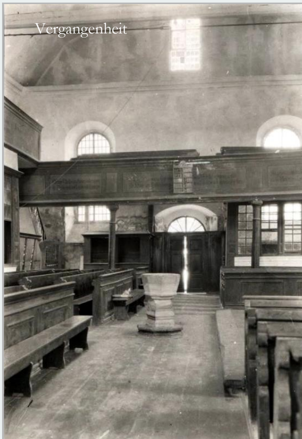
ST. NICOLAI IM WANDEL DER ZEITEN