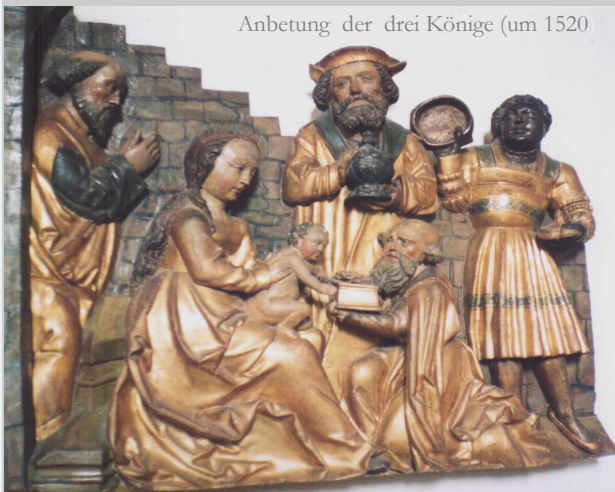
Anbetung der drei Könige (um 1520)

Wie ein Fels in der Brandung steht seit vielen hundert Jahren im Zentrum Niedergebras die St. Nicolai - Kirche. Zeiten der Blüte und Zeiten des Niedergangs hat sie erlebt. Krieg und Frieden haben an Ihr Spuren hinterlassen. Aber sie steht noch immer. Viele Generationen hat diese Kirche ein Leben lang begleitet und viele Menschen haben hier Trost gefunden.