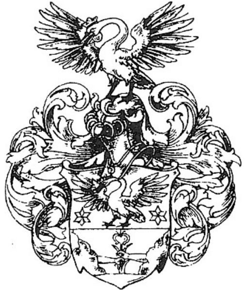
WAPPEN DES JOHANNES MYLIUS AUS LIEBENRODE

Über eine Kuchenspende für die Kaffeetafel am 27. Juni 2015 würden wir uns freuen! (Kuchenspenden können am Vorabend oder um die Mittagszeit abgegeben werden. Unter dem Kuchenteller bitte Ihren Namen vermerken!)